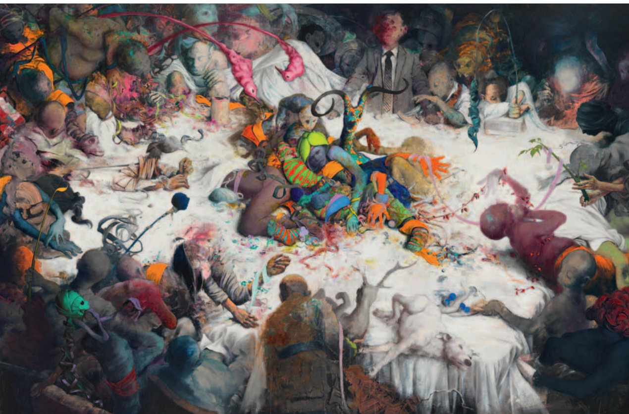
10 Jonas Burgert, Anfrass , 2017, 280 × 440 cm, Foto: Lepkowski Studios, Courtesy: der Künstler