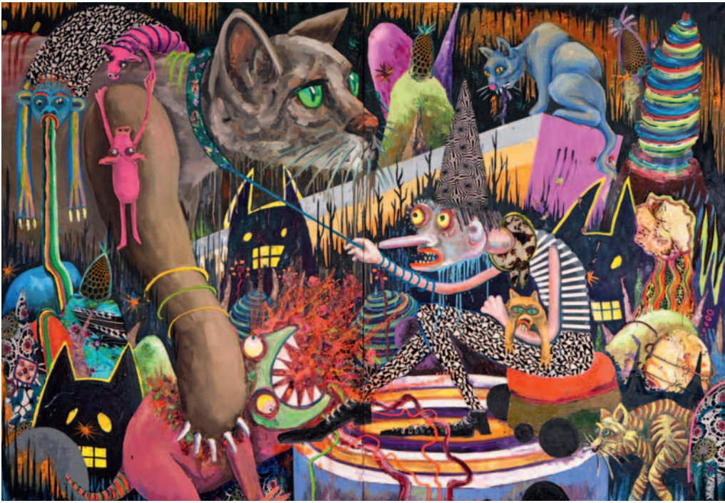
08 oben : Stefanie Gutheil, Big squeezing cat , 2011, Öl und Stoff auf Leinwand, 280 × 400 cm, Foto: Corinna Liebreich, Courtesy: Galerie Russi Klenner und © Stefanie Gutheil