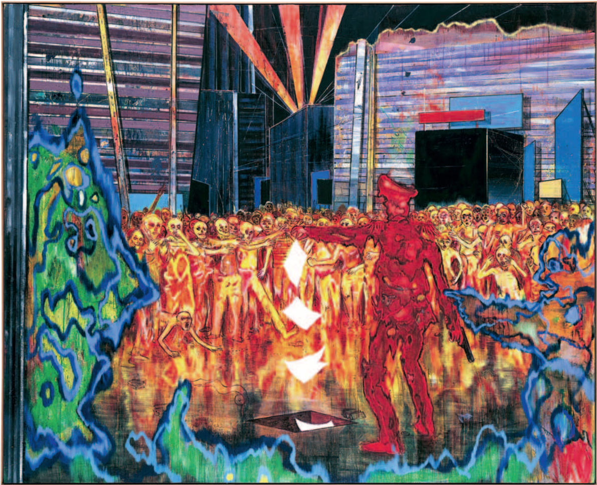
01 Daniel Richter, Captain Jack , 2006, Öl auf Leinwand, 268,5 × 332,5 cm

heißt“, der „in Schutzflorida liegt, als wäre Wald Disney World samt und sonders aus Orlando, Florida geradewegs ins All verrückt worden [...]“ 7