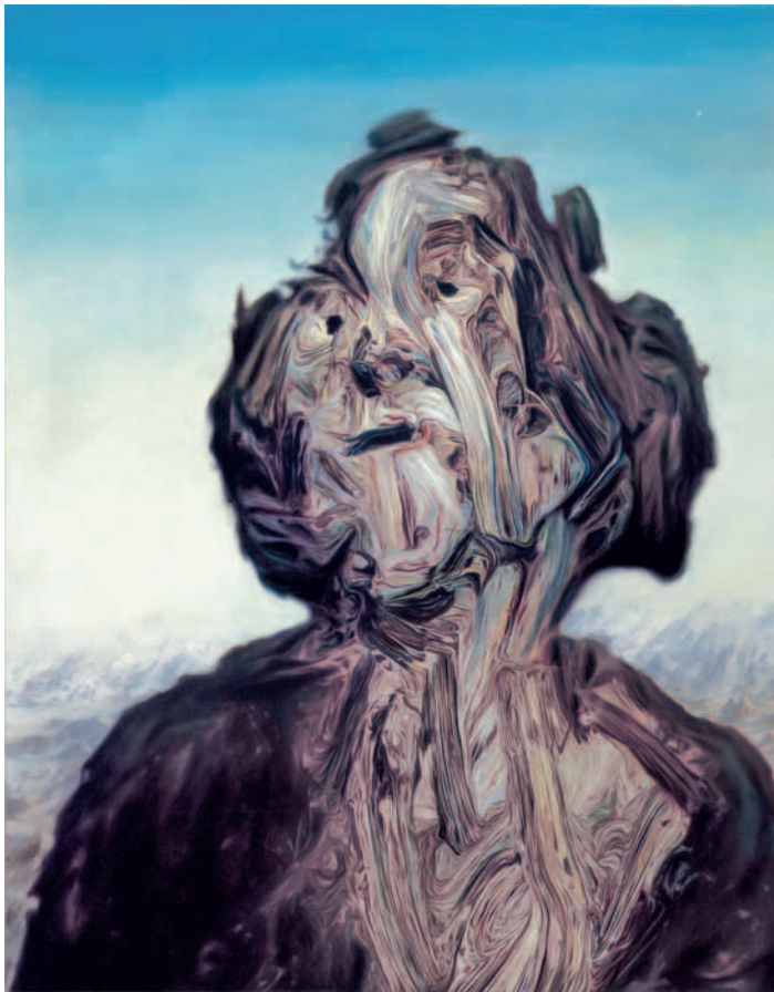
04 links: Glenn Brown, Little Death , 2000, Öl auf Holz, 68 x 54 cm, Courtesy: der Künstler und Galerie Max Hetzler, Berlin, Paris, London